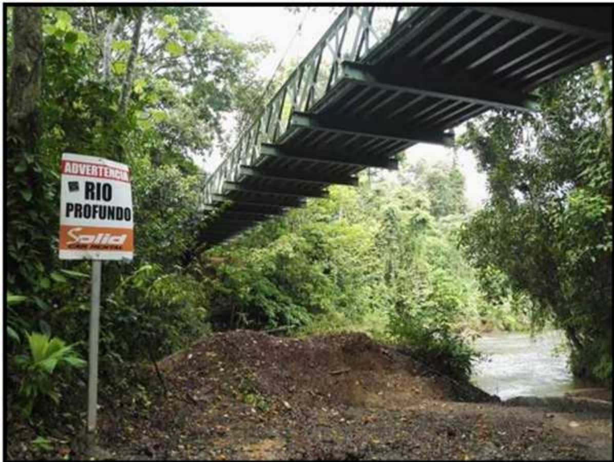
Figura A. Vista desde abajo

El puente inspeccionado se ubica en sector de Los Planes, del distrito Bahía Drake, Osa, Puntarenas.