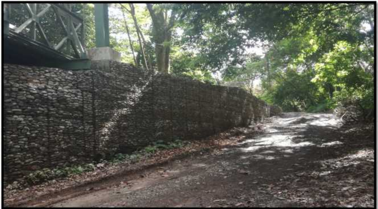
Imagen C. Vista Lateral