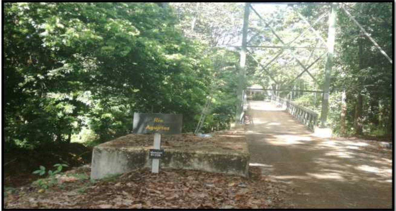
Imagen B. Vista a lo largo