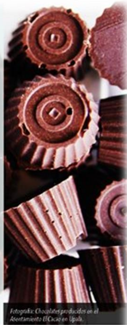
Fotografía: Chocolates producidos en el Asentamiento El Cacajón Igual.

Esta actividad contribuye a mejorar las condiciones de las familias de los asentamientos campesinos promovidos por el Inder, mediante la ejecución de módulos de capacitación y el desarrollo de actividades productivas sostenibles orientadas a que los recursos sirvan tanto para facilitar su acceso a una dieta familiar balanceada, como el apalancamiento de un excedente productivo. Además, estimular la producción de las familias y organizaciones en el medio rural mediante la implementación de proyectos de desarrollo que mejoren la calidad e inocuidad de los productos y servicios, promuevan la diversificación de los sistemas de producción y la sostenibilidad social, económica y ambiental. El apoyo que el Inder brinda en esta actividad, permite a los beneficiarios convertirse en pequeños productores que pueden dar valor agregado en la etapa postcosecha.