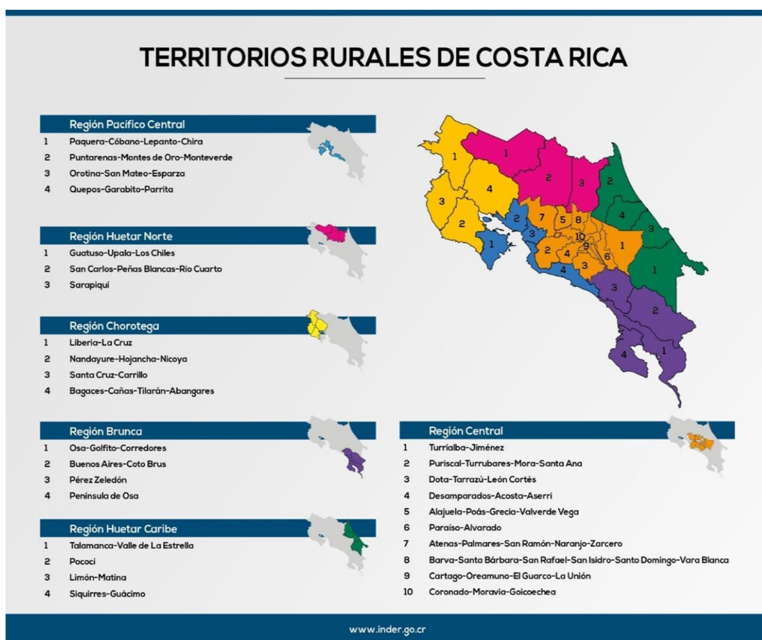
Figura 1. Regiones y territorios rurales de desarrollo