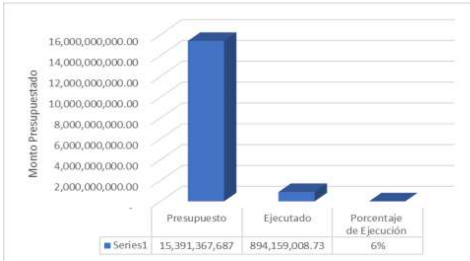
Gráfico 3. Inversión Programa Gestión para el Desarrollo Territorial