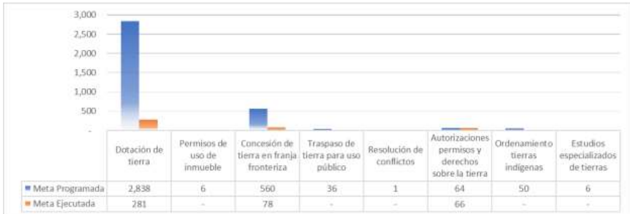
Gráfico 2. Servicios Fondo de Tierras