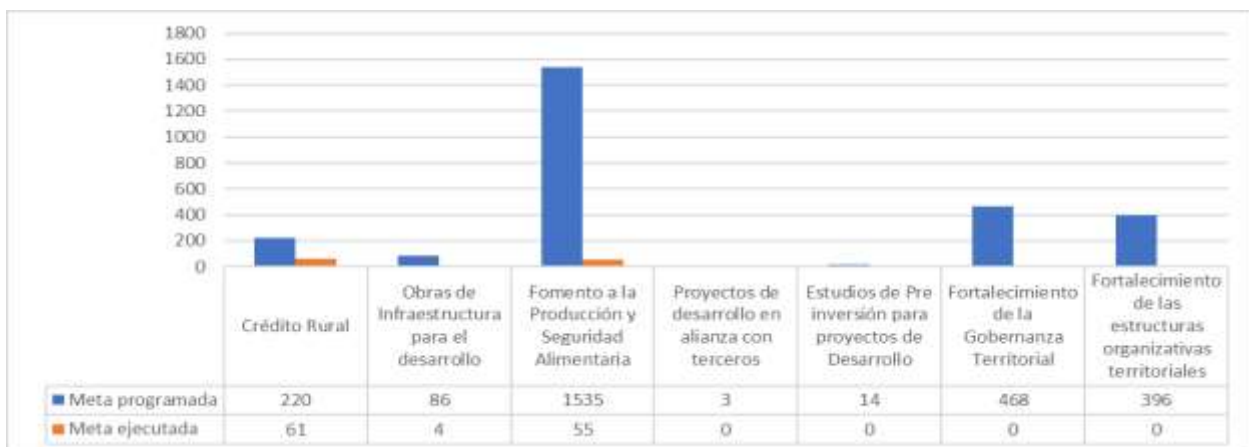
Gráfico 4. Servicios programados y ejecutados del Fondo de Desarrollo Rural