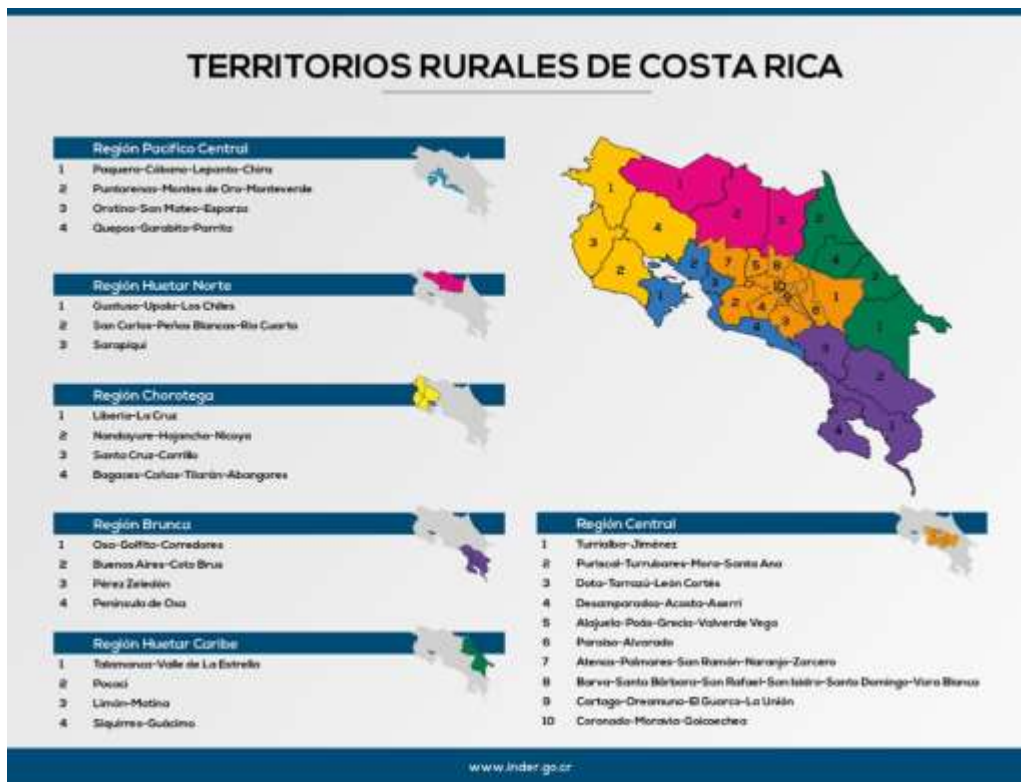
Ilustración 1 Territorios Rurales según Región de Desarrollo